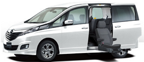
Fig. 6 BIANTE

リモコンまたはシート両側スイッチで簡単にシート操作ができる。オートリクライニング機能により、シート昇降中の頭上スペースのゆとりを広げ、移乗しやすいように、車いすの座面とほぼ同じ地上高までシート座面が下降する。