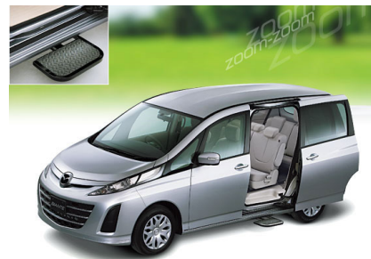
Fig. 9 BIANTE

助手席側スライドドアの開閉に連動して、ステップが自動展開・格納。乗降に安心のアシストグリップを装備する。