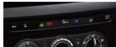
Fig. 2 Monitor

量産車では温度表示などがあるコンソール中央のインジケーターと同一レイアウトで教習モニターを装備した。これにより、速度・走行距離、方向指示器、ハイビーム、シートベルトワーニングの表示を指導員が前方から少ない視線の移動量で確認できるようにしている（Fig. 2）。