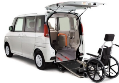
Fig. 5 FLAIR WAGON

常時、車いすを使用される方のクルマへの乗降をサポートする車。テールゲートに設けたスロープを使用して車いすのまま乗降ができるタイプをマツダは提供しており、フレアワゴンに設定している (Fig. 5)。