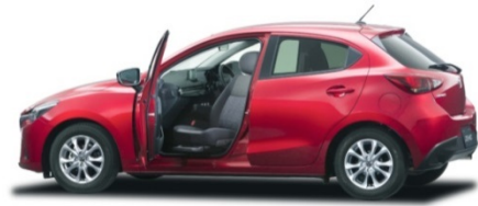
Fig. 8 DEMIO

シートへの着座に若干負担を感じる方をサポートする車。シートが手で回転し、座面が車外に出てくるタイプ。デミオの助手席に設定している (Fig. 8)。