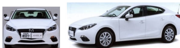
Fig. 1 Appearance of Driving School Vehicle

ベース車は、使いやすく、マツダ独自の‘魂動’デザインを採用した現行アクセラを採用している(Fig. 1)。