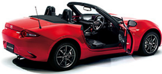
Fig. 10 ROADSTER