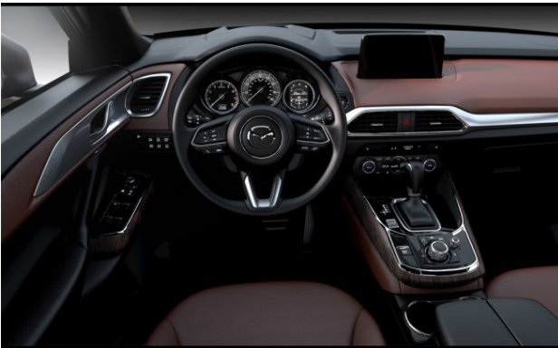
Fig. 8 Driver Oriented