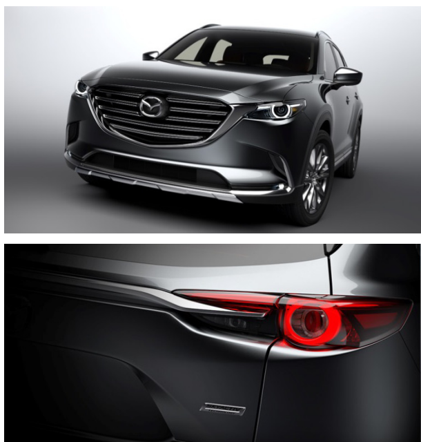
Fig. 5 Brand Face & Rear Combination Lamp