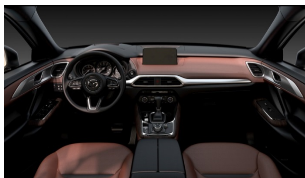
Fig. 7 Interior Structure

通常、インテリアデザインではインストゥルメントパネルのデザインが主役になりがちであるが、新型CX-9ではよりラグジュアリーな空間づくりをねらって骨格作りをメインにデザインをはじめた。乗員が快適に包まれて運転に集中でき、かつ開放感がありリラックスできる、そんな相反した要求を満たす空間を土台から組み立てることで実現した。