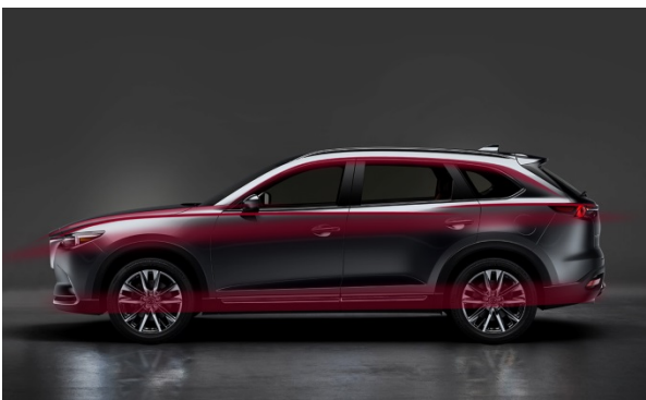
Fig. 3 Structure &amp; Form

力強いボディの上部に、3列シートゆえの長さを生かして、前後方向のスピード感を持たせた薄いキャビンをのせた。これにより、下半身が安定して上半身にいくほどスピード感があり、少々の横風ではびくともしないような力強さと前進感を併せ持った逞しいボディが完成した。また、上下の動きを抑制した造形は、新型CX-9のマチュアな顧客の好みにマッチした強く落ち着いた造形に寄与している。これまでの魂動デザインで追求してきた、Aピラーを後ろに引いてフロントノーズを長く見せつつ、キャビンをコンパクトに見せる造形を踏襲し、大型車における魂動デザインの理想形を体現した (Fig. 3)。