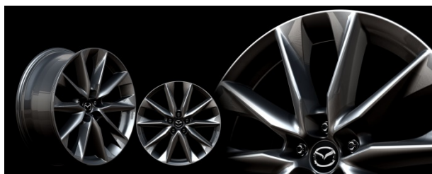
Fig. 6 20inch Wheel

造形の立体感をより強く感じさせるため、20インチ全車に、また18インチでもTouringグレードに高輝度塗装を採用した (Fig. 6)。