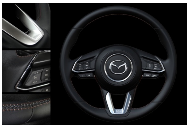
Fig. 11 Steering Wheel

確で快適な操作をサポートする次世代グリップ断面形状を採用し、しっかりと握れ、かつ回転時にストレスなく手のひらを滑らせることができるグリップ断面とスポーク付け根形状を実現した。SIGNATUREグレードは、室内カラーコーディネーションを考慮したカラードスペシャルステッチをあしらい、その他のグレードにもベースボールステッチを施して上質感を表現した (Fig. 11)。