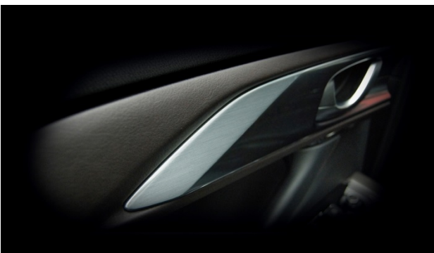
Fig. 9 Real Material Decoration Panel

また、実際にカタチを決める作業にも本物の木やアルミの職人と一緒に削りながら形状を作り、見映えだけではなく、触った時の触感、手触り、使い込んでいったときの風合いの変化など、使う人に長く愛着を持っていただけることにこだわった (Fig. 9)。