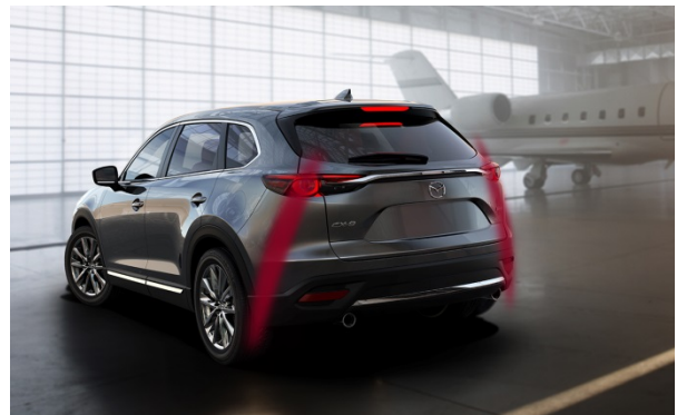
Fig. 4 Stance