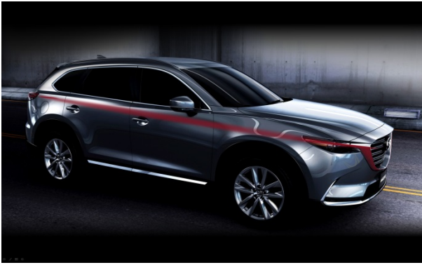
Fig. 2 Axis

ボディ造形は、力強い下半身の重量感とスピード感の両立をねらった。サイドシルにボリュームを持たせて、あえて上下方向の動きを抑え前後方向の直線基調のラインとすることで安定した土台とした。ボディサイドのショルダーのキャラクターは、小型車系の魂動デザインを持つ上下方向の躍動感を抑えて、前後方向のスピード感あるラインとした。