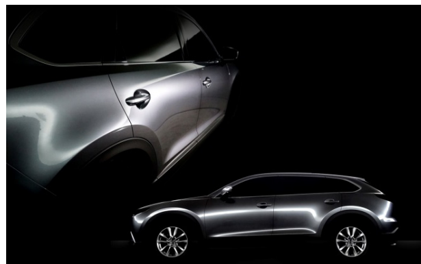
Fig. 1 Design Concept Image

上質を表現するには、形状の良し悪しと同時に、それが「いかに精緻に組み合わせられているか？」が重要である。どんなに精巧に作られたパーツも、フィット&フィニッシュが雑ではプレミアムの精緻な感動が生まれない。ダイナミックで力強い骨格に本物素材。そこに精緻なフィット&フィニッシュが加わった時に、初めて感動を生む“おごそかで品格のあるプレミアム”の価値が生まれる。