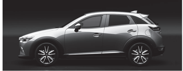
Fig. 5 Side View

ボディーの外にまでつなげるイメージでデザインすることで、実際のサイズ感を圧倒的に上回る伸びやかさを演出した。更に、前後フェンダーとサイドシルのブラックのガーニッシュとボディーカラーとの対比によって、その前後方向への伸びやかさをより一層強調している（Fig. 5）。