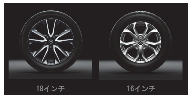
Fig. 9 Wheel Design

16インチホイールには、実サイズよりも大きく見せる彫刻的な印象のデザインを採り入れた。彫りの深さや軽量化はもちろん、リム断面も数mm単位でこだわり抜き、質感高く造り込むことで、16インチながらもシンプルかつ大胆なスタイリングの実現に大きく貢献している。