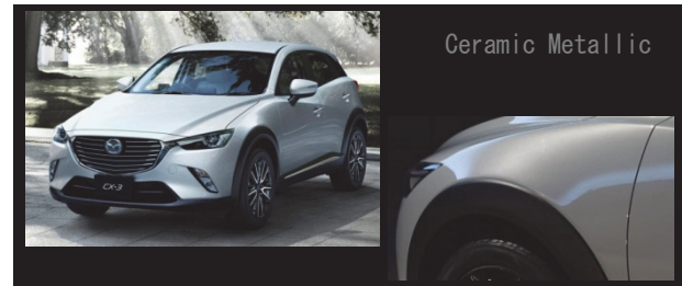
Fig. 18 Body Color of Ceramic Metallic

澄まされた金属感や緻密な硬質感を表現し、光によって表情が変化する、まったく新しい質感表現にこだわって造り上げたボディーカラーである。通常時はソリッドな雰囲気キャラクターラインをシャープに強調し、エッジの効いたクールさを醸成した。そして明るい環境下では、ハイライトの鋭く白い艶やかな輝きによって、未来的な表情を造り出している（Fig. 18）。