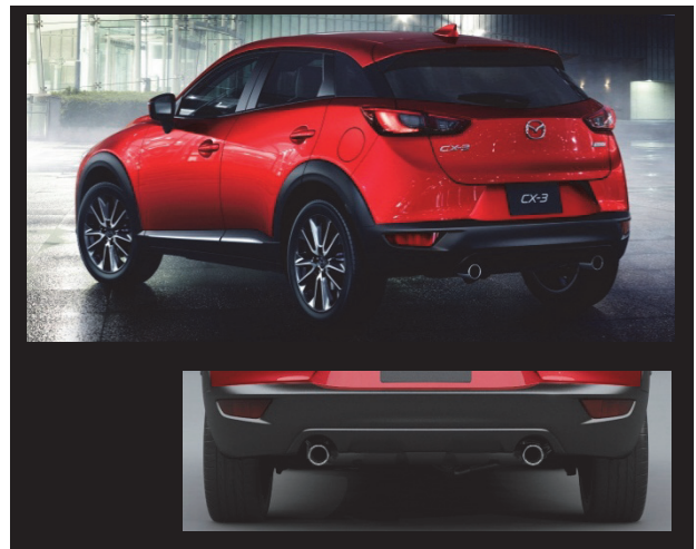
Fig. 6 Rear View

通常リフトゲートもしくはバンパー下端に配置されることの多いライセンスプレートを、リフトゲートと同色のバンパー上部にリセスを設けて配置し、立体的かつすっきりとしたリフトゲート面と、非常に短いイメージのリアオーバーハングを実現した。またライセンスプレートの取り付け段差を利用し、カメラやスイッチ等のリフトゲートに求められる機能部品のすべてを視線から隠れる所にレイアウトした。ゲート面とバンパー面とのパーティング段差を2mm以内に抑えるという高精度な仕上げ品質と相まって、連続感とクリーンな印象が際立つリアエンドデザインを実現した。エグゾーストパイプは左右2本出しとして、力強さとスポーティさを強調し、更に、ブラックアウトしたDピラーによってサイドウィンドウからバックウィンドウへのつながりを持たせ、キャビンをガラスで包み込むような造形としたことで、Dピラーの存在感を消したキャビンの抜けの良いイメージを際立たせている。こうした造形と、ボディーサイドから連なるショルダーをしっかりと感じさせるボリューム感によって、他に類のない圧倒的な塊感と力強いスタンスを感じさせるリアビューを造り上げた。