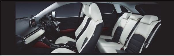
Fig. 13 Cabin Design