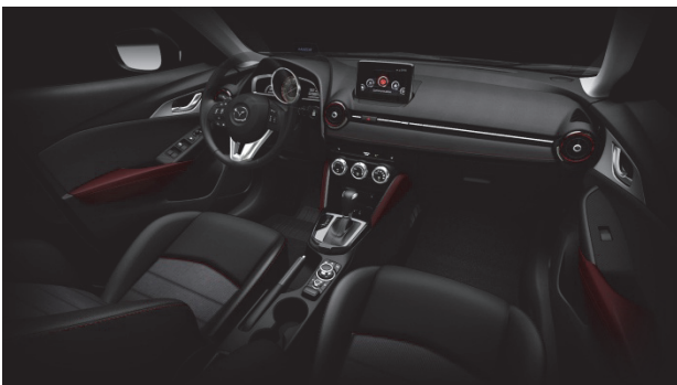
Fig. 21 x Performance Mode

シートのメイン素材はブラックのレザーレットとし、センター部にダークグレイの精緻なイメージの新開発ファブリックを用いて、x Futureと同じダークレドのアクセントカラーを効果的に配している。これらにより、一般的なストイックなスポーティな世界とは一味違う、スタイリッシュさとスポーティさの融合した新しいイメージを創り上げている (Fig. 21)。