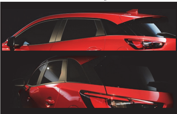
Fig. 11 Cabin Design

キャビンはピラー類をすべてブラックとし、ウインドウを連続したガラス面に見せている。特に最後部ではブラックのドアサッシュとDピラーガーニッシュを設定。段差を極力少なくするパーツ構成や見せ方に留意しフラッシュな印象に仕上げ、リフトゲートウインドウまで滑らかにつながるようにしたことで、「後方へと抜けて行く開放的で伸びやかな動き」を強く感じさせている。またベルトラインがリアフェンダーのピークへ向かって上昇するのに対し、ルーフラインをDピラーの上で少し下降させてリアフェンダーへの塊をフォローするイメージのアクセントをつけ、塊のまとまり感も演出した。これは同時に単調になりがちな6ライトウインドウのグラフィックに、リズムを持たせるという効果も持たせている (Fig. 11)。