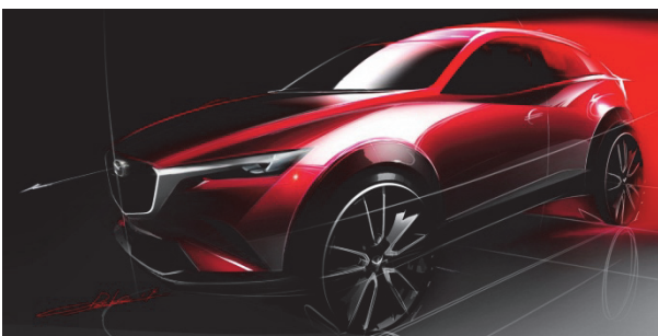
Fig. 1 Exterior View

このように、塊感のある圧倒的なプロポーションと強いスタンス、そしてサイズを超えてダイナミックに広がる勢いのある表現を、量産車においても妥協なく追求したことで、新ジャンルにふさわしい、比類のないスタイリッシュなアピラランスを生み出すことができた。