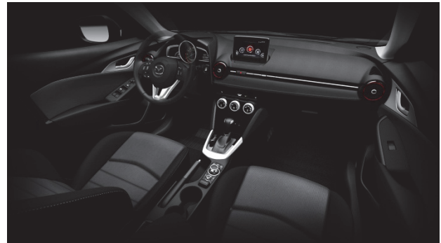
Fig. 22 x Edge Mode

レッドとしてモノトーンの中にスパイスを利かせ、シンプルなダークスーツをスタイリッシュに着こなすような知的なテイストを醸し出している (Fig. 22)。