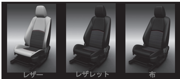
Fig. 17 Seat Design

レザーシートは、センター部にラックススエードを採用するコンビネーションとし、スポーティな中でも高い質感も待たせている。素材の切り替わるきわには、スタイリッシュなアクセントとなる新開発のソフトなパイピングをあしらい、更にセンター部表面に縫製仕上げを施して、立体感と素材の表情の豊かさを強調。後席にも同じ素材遣いとパイピング、縫製仕上げを採用して全体への造り込みに配慮している。レザーレット仕様のセンター部とファブリックシートには、艶の見せ方に徹底的に注力して開発したセミマットな布地を採用し、柄ではなく精緻な素材感をもたらす魅力によって全く新しい質感を実現。このシートでもセンター部に縫製仕上げを施して、素材の持つ絶妙な艶による素材感を一層引き立てている（Fig. 17）。