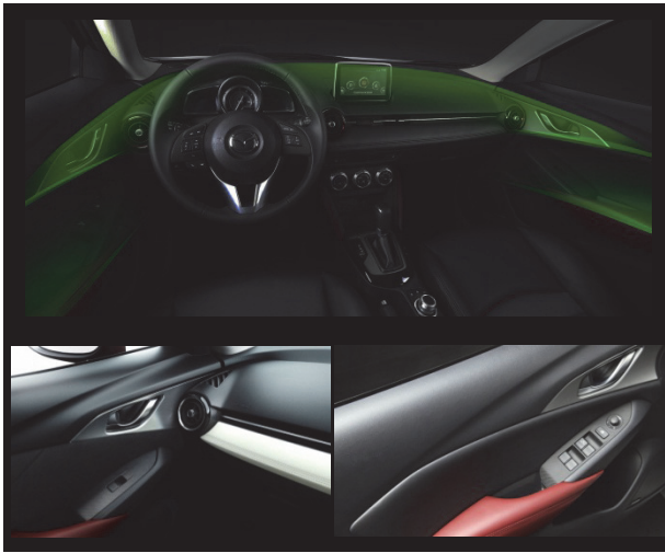
Fig. 16 Door Trim Design