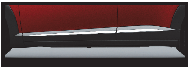
Fig. 10 Side Garnish Design

更にハイグレードモデルでは、サイドシルガーニッシュの高輝度シルバー塗装のブライトモールディングを通し、スピード感とクオリティー感を高めている (Fig. 10)。