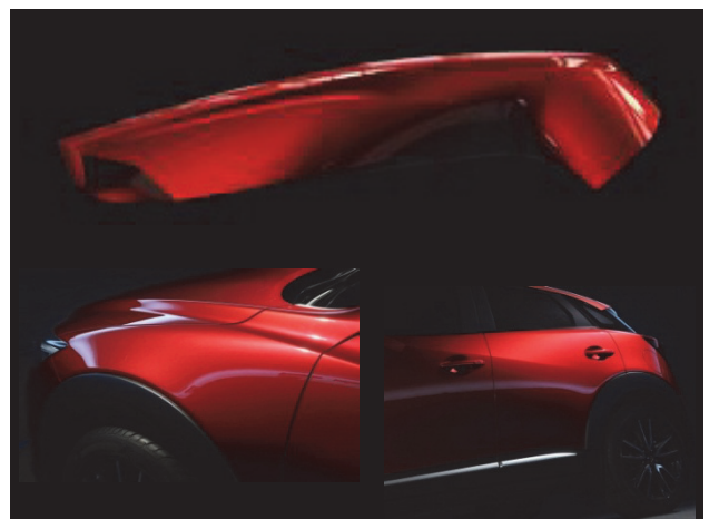
Fig. 3 Fundamental Element