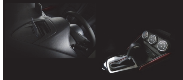
Fig. 15 Instrument Panel and Console Design

を元にイメージを再現。こうした造り込みにより、大人の雰囲気が漂うメーターフードを完成した。更に、ハイグレードのコンソールシフトブーツには、周辺のアクセントとコーディネートを取ったダークレッドのストライプを配する造り込みをした (Fig. 15)。