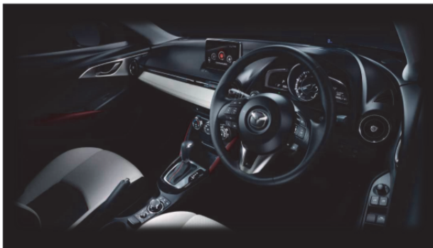
Fig. 14 Front Seat Space Design

コックピットには新世代モデルに共通の、ドライバーが走りを楽しむことに集中できるドライバーオリエンテッドな空間を追求。マツダのヒューマンマシンインターフェイス (HMI) 思想「Heads-up Cockpit」のコンセプトに基づき、ドライバーを中心にメーターやディスプレイ、コマンダーコントロールなどを適切に配置している。助手席側では、横方向への広がり感を際立たせるデコレーションパネルに、ステッチを施したソフトパッドを採用。この横への広がり感を、インストルメントパネル端の丸型エアコンルーバーを経て、ドアトリムの印象的な金属調加飾へと連続させることで、前席空間の一体感を更に強調している (Fig. 14)。