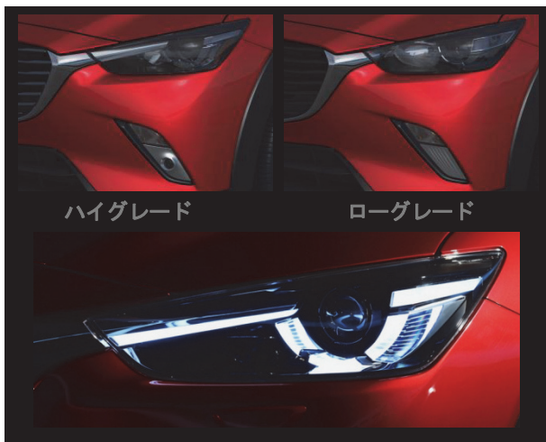
Fig. 7 Lamp Design (Front)

またターンランプとフォグランプを収めたフロント下部のコンビネーションランプユニットは、フォグランプのLED化で実現した細く縦長のユニークなベゼル形状をもち、サイドから見ると前傾によるスピード感を、正面視ではハの字型の力強いスタンスを表現した（Fig. 7）。