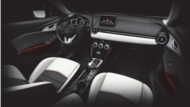
Fig. 20 x Future

ークレドの素材を大胆にあしらい、メタリックパネル部分にはアルミを削り出したようなヘアライン調の加飾を採用した。これらにより、ターゲットカスタマーの感性に訴えかける一歩先を行く新しさと造り込みを表現している (Fig. 20)。