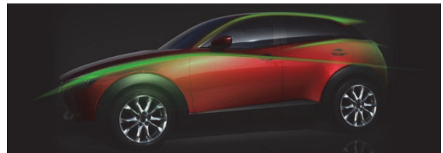
Fig. 2 Design Theme

この三つの塊はシンプルながら、非常にデリケートに刻々と移り変わる表情をもった面質を備えている。そしてそれらをつなぐ面を更にドラマチックに変化させ、その間に生まれる稜線を鮮やかに際立たせた。こうして生まれたCX-3のボディー造形は、シンプルでシャープなイメージのなかに、変化に富んで深みのある表情を創出することができた。そしてこの表情は、人の手仕事による入念な造り込みによる、魂動デザイン特有の技によって創りだした。