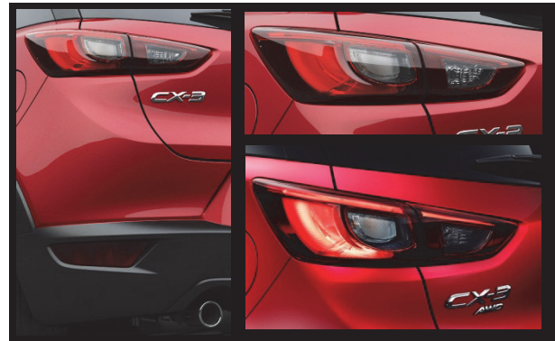
Fig. 8 Lamp Design (Rear)

リアエンドでは、リッドランプの採用と、リフレクター／フォグランプ／サイドRR等（仕向けにより機能が変わる）の機能を一体化して、バンパー部へ分離させることで、ヘッドランプと同じく薄くシャープな横長のリアコンビネーションランプ形状を実現した。導光技術によるランプ上部の光るラインと、立体感のあるテール／ストップランプを組み合わせた発光シグネチャーとすることで、しっかりとした記号性を持たせ、マツダの個性を際立たせる印象的な後ろ姿を創り上げている（Fig. 8）。