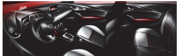
Fig. 12 Interior Overall View

エクステリアに呼応する先鋭的な造形と手造りの質感という相反する要素のコントラストを活かし、これまでにないスタイリッシュさの実現を、デザイン開発のテーマとした。室内の造形はエクステリア同様にシンプルでスピード感のある動きの表現に統一し、伸びの良さや連続性を追求。同時に、既成のコーディネート概念にとらわれず、色や素材の選択は内装パッケージごとに徹底的に吟味し、視覚にも触覚にも上質で心地よく感じられるよう、クラフトマンシップにあふれた仕立てに注力した (Fig. 12)。