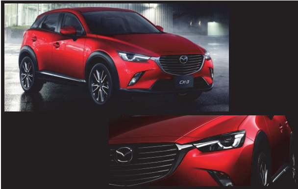
Fig. 4 Front View

クロスオーバーの車高の高さを活かし、フロントノーズは通常のパセジャーカーより高く設定し、ボリューム感のある自信に満ちた佇まいにした。フロントグリルには7本のフィンがあり、先端をシルバー塗装（ハイグレードのみ）にしたことで、マツダシンボルから横方向へと密度をもって広がるエネルギーと、精緻な造り込みを感じさせている。ライセンスプレートはロア開口部（グリル外）に置かれ、グリルの精緻で力強い印象を損なうことがないようこだわった。新世代商品の証であるシグネチャーウィングは、削り出された金属の強さをイメージし、全身に漲るスピード感のスタートポイントとして骨太かつ立体的に造形した。そのシャープなラインはスリークなLEDヘッドランプに一体化し、夜間にはランプ内のライティングシグネチャーと直線的につながって強烈に個性を主張している。