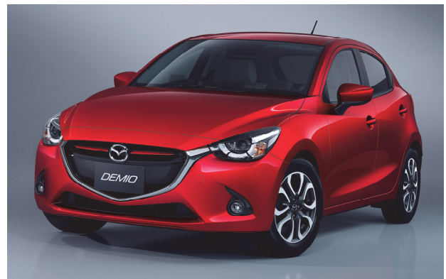
Fig. 4 Wide Stance and Trapezoid Shape