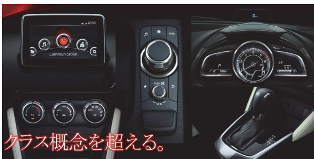
Fig. 11 Stunning Quality

夜間照明色はすべて白色化し、洗練された上質さを表現した (Fig. 11, 12)。