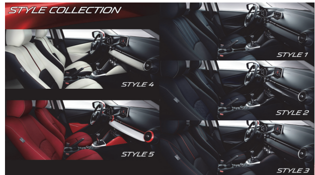
Fig. 14 Interior Color Coordination