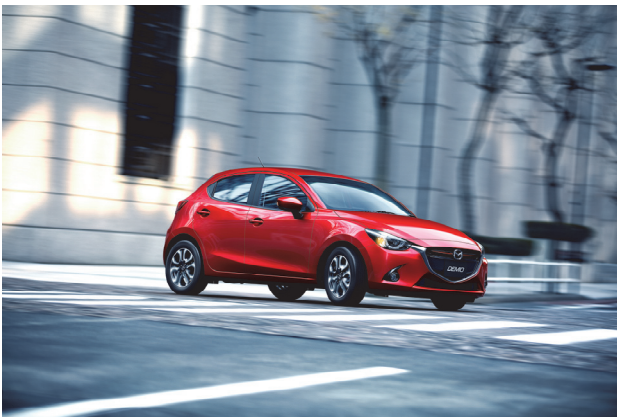
Fig. 1 Exterior Overall View

インテリアでは、ドライビングに集中できるコックピットと抜けのよい助手席空間を鮮やかな対比でデザインし、細部に至るまで素材と形状を吟味して質感高く造り込んだ。また、自分のお気に入りの服を選ぶようにクルマのカラーコーディネーションを選べる「スタイルコレクション」では、スタイリッシュなラインアップを揃えた（Fig. 1）。