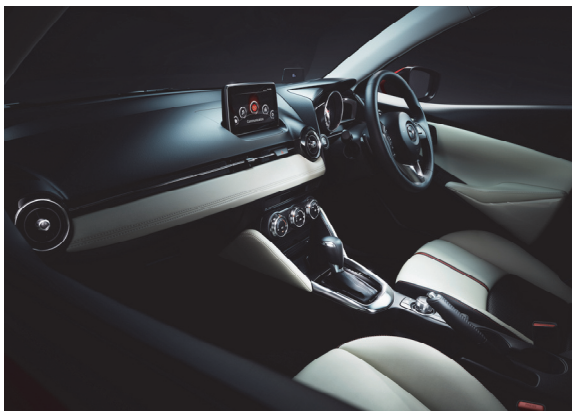
Fig. 8 Interior Overall View

デザインのヒントは小型飛行機である。メーターフードから広がるインストルメントパネルは飛行機の翼、丸い空調ルーバーはジェットエンジンの排気口、ドアトリムに放射状に広がるラインはジェットエンジンから吹き出す気流をイメージし、大空を翔るようにこのクルマを操っていたほしいとイメージしてデザインした (Fig. 8)。