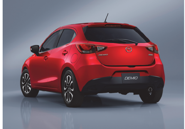
Fig. 6 Rear View

ルーフエンドでは、リフトゲートの上端をスポイラー形状とすることで、高い空力性能と美しさを両立した (Fig. 6)。