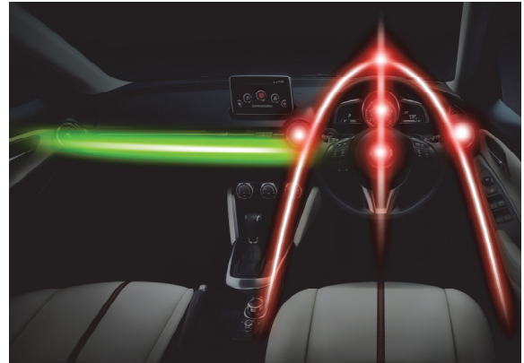
Fig. 9 Interior Space

した。そして助手席側には、性能を犠牲にすることなく約 30mm という通常の半分以下の高さを達成した薄型ルーバーを採用し、インストルメントパネルのスリットと一体化させてその存在感を消している。これにより、cockpit と助手席を車両の中央で隔てていたセンタースタックの存在を排除でき、広々とした革新的な助手席空間を造り上げている (Fig. 9)。