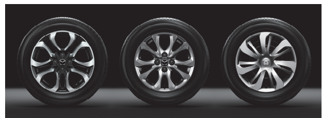
Fig. 7 Wheels (16"Alloy, 15"Alloy, 15"Steel with Cap)

フルキャップスチールホイールは、大小2本のスポークを立体的に組み合わせ、強さとしなやかさを併せ持つデザインとした (Fig. 7)。