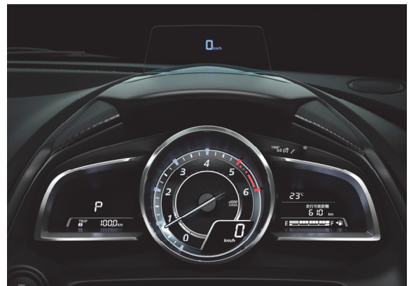
Fig. 10 Human Machine Interface

メーターは、円形の 1 眼メーターをウイング状のデジタルディスプレイで挟んだレイアウトを採用している。ハイグレード仕様では、中央をアナログタコメーターとデジタルスピードメーターを組み合わせ、左右にはインフォメーションディスプレイを配置した。その他の仕様では、中央をスピードメーターとして、左側のウイングにデジタルタコメーターを配置した。金属調のリングや精緻な立体文字盤により、スポーティかつ上質なデザインとした (Fig. 10)。