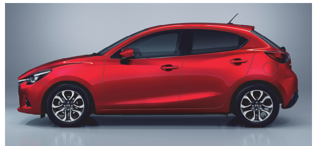
Fig. 3 Cabin Proportion