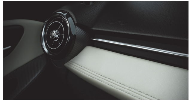
Fig. 12 Stunning Quality