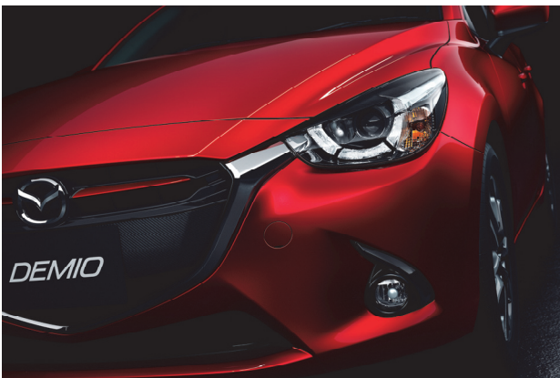
Fig. 5 Front-end Design

ラジエーターグリル内部は、冷却開口エリアとライセンスプレートエリアを明確に分けた、上下2段構成とした (Fig. 5)。